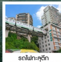
รถไฟฟ้าทุติย

มหาศาลาประชาชน / รถไฟฟ้าทุติย ถนนคนเดินเจียงฟางเป่ย์ / ล่องเรือสำราญ CENTURY VICTORY CRUISE ล่องเรือแม่น้ำแยงซีเกียง / โชว์สามก๊ก / ช่องแคบอูเลีย ช่องแคบชวี่กิงเสีย / นั่งเรือเล็กชมเส้นหนึ่งซี / งานเลี้ยงอำลาจากทางเรือ นั่งลิฟท์ข้ามเขื่อนซานเสี่ยต้าป้า / Three Gorges Project Museum