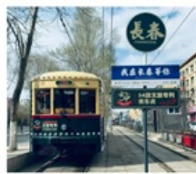
นั้งรกรางดางซุน