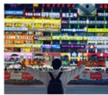
กำแพงมหาวิทยาลัยเหยียนเปียน