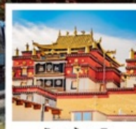
วัดชงจันหลิง

ทัวร์คุณธรรม ไม่ลงร้านช้อปปิ้ง ไม่ขายออฟชั่น