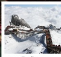
กุหาหิมะมังกรหยก