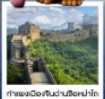
กำแพงเมืองจีนผ่านซือหม่าโต

เมืองโบราณกู่เป่ย์ซู่เจิ้น / กำแพงเมืองจีนด่านซือหม่าโต (รวมค่ากระเช้าขึ้น-ลง) / ชมวิวกำแพงเมืองจีนและเมืองโบราณ ยูนิเวอร์แซลปักกิ่ง (รวมค่าบัตรเข้า) / จตุรัสเทียนอันเหมิน / พระราชวังโบราณฤดูร้อน / หอบูชาเทียนถาน คาเฟ่ทาฟังกาเป่ย์ (TANG FANG CAFE) / พระราชวังฤดูร้อนอวิ๋เหอหยวน / ย่านชานหลี่ถุน (POP MART) / ถนนคนเดินไท่กู่หลี่