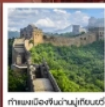
กำแพงเมืองจีนด้านมู่เถียนยวี่