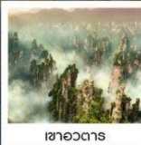
เซาอวตาร