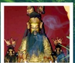
เฮียงบู๊ซิว