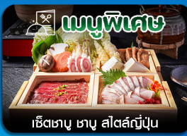
เช็ตเตาบุ ซาซุ สีสต์ญี่ปุ่น