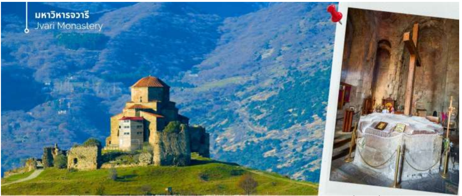
มหาวิหารจวารี Jvari Monastery

จากนั้นอิสระ ถนนคนเดินชาเดอनी (Jan Shardeni Street) เป็นถนนคนเดินสายสั้นๆ ที่ตั้งอยู่ใจกลางย่านเมืองเก่า (Old Tbilisi) ของเมืองหลวงทบิลีซี ประเทศจอร์เจีย ถนนสายนี้ได้รับการยกย่องว่าเป็นหนึ่งในศูนย์รวมทางสังคม ไลฟ์สไตล์ และวัฒนธรรมที่คึกคักที่สุด โดยผสมผสานสถาปัตยกรรมแบบคลาสสิกดั้งเดิมเข้ากับกลิ่นอายความโรแมนติกแบบยุโรป ย่านนี้เต็มไปด้วยอาคารเก่าแก่สไตล์วินเทจ คาเฟ่ริมทาง บาร์ไวน์ และแกลเลอรีศิลปะเก๋ๆ แหล่งแฮงค์เอาต์ยามค่ำ คีนส์วอร์คของคนรักอาหารท้องถิ่นและเลือกซื้อของที่ระลึกที่นั่นได้