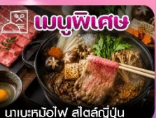
เมนูพิเศษ ทะเลหมีโอไฟ สัตว์ญี่ปุ่น

SCAN ME ซัปโปโร-อาซาฮิกาว่า-ลานสกีชิโกะ-คลองโอตารุ-โรงงานช็อกโกแลต-หมู่บ้านเทพนิยาย-ช้อปปิ้งทานุกิโคจิ-อีสระเต็มวัน