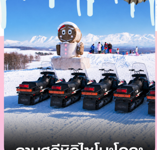
ลานสกีซึกิโซโนะโอกะ