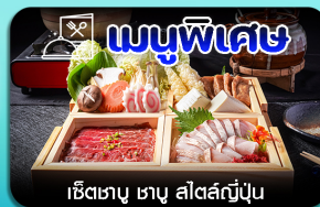
เมนูพิเศษ เชื้อซาซู ซาซู สีสต์ญี่ปุ่น