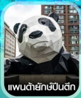
แพนด้ายักษ์ป็นตีก