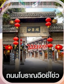
ถนนโบราณฉือชี่โฮว

✈️ คอนเฟิร์ม ออกเดินทาง ทุกพีเรียด 2 ท่านขึ้นไป