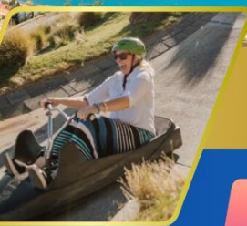
เล่นลู่ ที่ควีนส์ทาวน์

บินภายใน (เที่ยวสุดคุ้ม) พักโรงแรม 4 ดาว ★★★★★