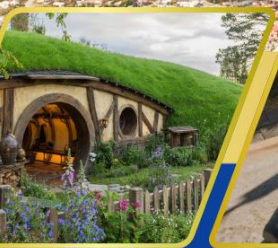
หมู่บ้านฮ็อบบิต