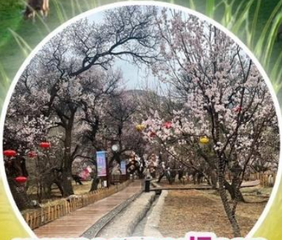
หุบเขาดอกแอปเปิ้ล

ทุ่งหญ้าซิลามูเหริน - พิธีการขอพรจากไอวเฮา - ปาร์ตี้กองไฟ - หมู่บ้านชนเผ่ามองโก สวนวัฒนธรรมมองโกเลียเหมิงเสียง - หุบเขาดอกแอปเปิ้ล - ทะเลทรายอินเคินทาลา แหล่งวัฒนธรรมมองโกเลียหยวนหลิว (รวมรถกอล์ฟ 2 ขา) - ตลาดกลางคืนเจียไท่ สวนวัฒนธรรมการแต่งงานสุดเอ็กซ์คลูซีฟแห่งเดียวในประเทศจีน บ้านองค์ปฐม - เซตการท่องเที่ยวเจงกิสข่าน-ถนนคนเดินคังปาซือ