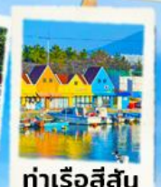
ท่าเรือสีสัน