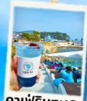
คาเฟ่ริมทะเล