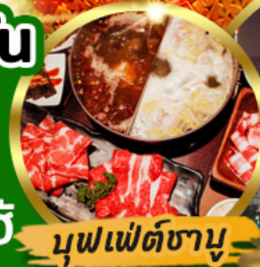
บุฟเฟต์ชาบู