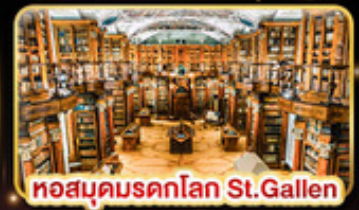
หอสมุดนครค็อล St.Gallen