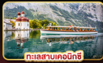
ทะเลสาบเคอนิกซี