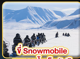
ขี่ Snowmobile บนธารน้ำแข็งพันปี