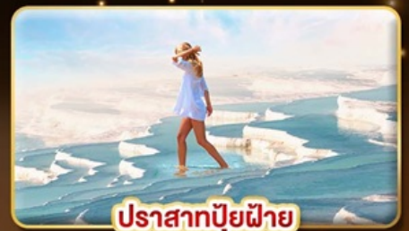
ปราสาทบูยูญา