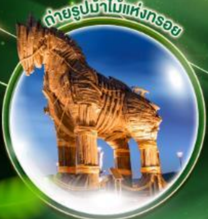
ถ่ายรูปล้ำไม้แห่งทรอย