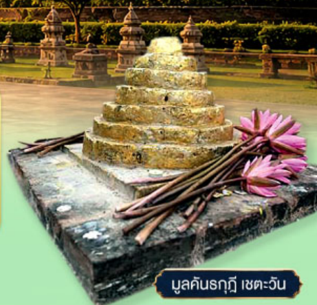
มุลคันรฤฎี เขตตะวัน