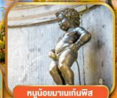
ทูน้อยมานเทินพิส