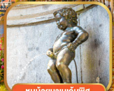
หูน้อยมานกันพิส