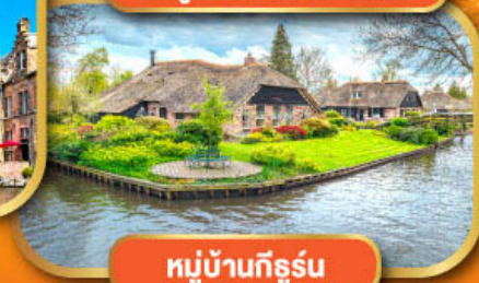
หมู่บ้านกึธรุน