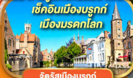
จัตุรัสเมืองบรูคซ์