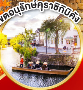
เขตอนุรักษ์คุราชิกิบิคัง