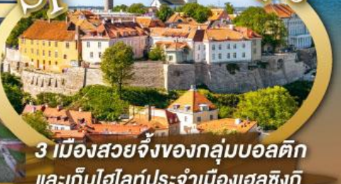
3 เมืองสวยจิ้งของกลุ่มบอลติก และเก็บไฮไลท์ประจำเมืองเฮลซิงกิ และล่องเรือเฟอร์รี่ข้ามประเทศ

ไฮไลท์ในโปรแกรม • เที่ยวสามประเทศหลักกลุ่มบอลติก • ชมเมืองหลวงวิลนิอุส ประเทศลัตเวีย