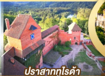
ปราสาทกูโรต้า