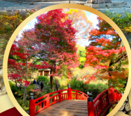
สวนดอกบ๊วยอาตานิ