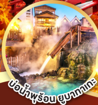
บ่อน้ำพุร้อน ยูบาคาเกะ