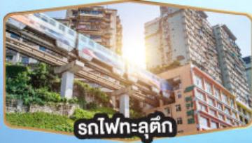
รถไฟฟ้าสุดคึก