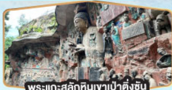
พระแกะสลักหินเขาเป่าต้งซัน