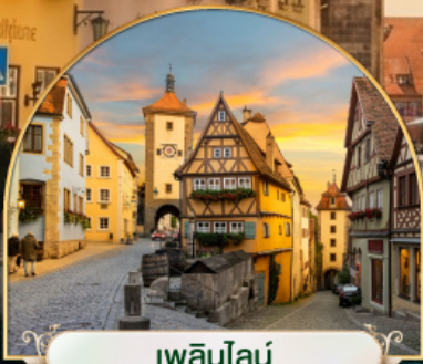
เพลินไลน์