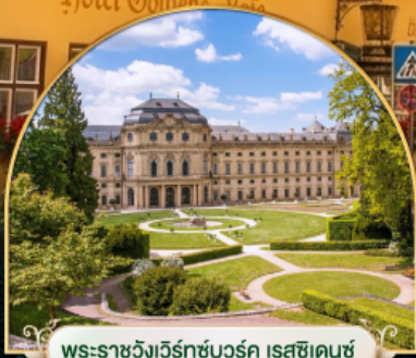
พระราชวังเวร์ทซ์บวร์ค เรสซิเดนซ์