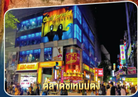
ตลาดซีเหมินตง

เมนูพิเศษ ! Buffet Shabu, Taiwan Seafood