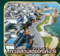
ทะเลสาบเอ้อไห่โค้ง S