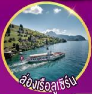
ห้องเรือลูเซิร์น