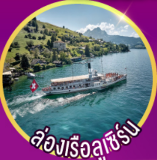
ล่องเรือลูซิิร์น