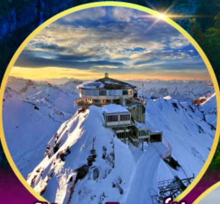
ยอดเขาซิลรอร์น