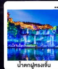
น้ำตกฝูหลงจิ้น

"มหัศจรรย์...จางเจียเจีย" | ดินแดนแห่งขุนเขาและสายน้ำ "เขาเกียนเหมินซาน" | ประตูล่องเรือ...ท่าอากาศยาน 999 ชั้น | นั่งรถไฟความเร็วสูง สัมผัสความสวยงามระบียงแกว "อุทยานอวตาร" | ส่องล่องกลางขุนเขา...ดั่งภาพฝันในห้วงนเจียเจีย | ซุปปัง POPMART "เมืองโบราณ"ฝูหลง" หยุตเวลา ณ เมืองบนม่านน้ำตก... | "เฟิ่งหวง" ล่องเรือชมชีวิตริมแม่น้ำทิวเจียง "นครฉางซา" ปิดท้ายความทันสมัย