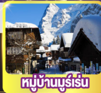
หมู่บ้านมูร์เรน