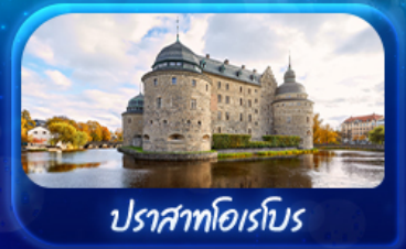
ปราสาทไอเรโบ