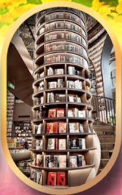
อุทยานปีติงโกว