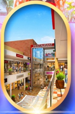
มิตซุชิอากะอิเคอิ