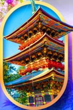
วัดนาริตะชิน