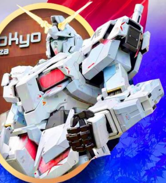
ห้างไอโดปะกันดั้ม