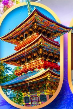
วัดนาริตะซัน