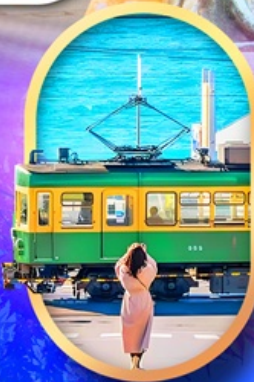
ถนนโคมาจิโคริ