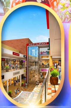
บิตซูเอ็กซ์พรีเซนต์