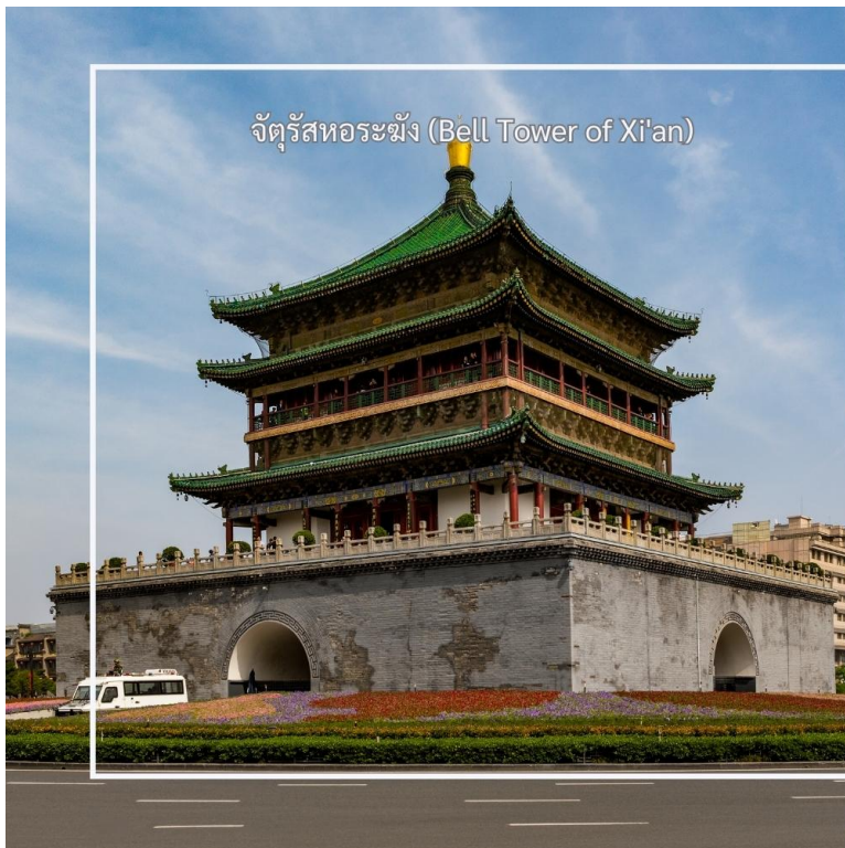
จัตุรัสหระฆัง (Bell Tower of Xi'an)

จากนั้นนำท่าน ผ่านชมจัตุรัสหอกลองและหระฆังซีอาน (Xi'an Drum & Bell Tower) แลนด์มาร์คสำคัญที่ตั้งอยู่ใจกลางเมืองซีอาน และถือเป็นสัญลักษณ์ทางประวัติศาสตร์ของเมืองหระฆังและหอกลองสร้างขึ้นในสมัยโบราณ เพื่อใช้บอกเวลาและส่งสัญญาณเตือนภัยให้กับผู้คนภายในเมือง โดยในอดีตจะตีระฆังในช่วงเช้า และตีกลองในช่วงค่ำ จนได้รับการขนานนามว่าเป็น “ระฆังรุ่งอรุณ กลองยามค่ำ” ปัจจุบันสถานที่แห่งนี้ยังคงได้รับการอนุรักษ์ไว้อย่างดี และเป็นอีกหนึ่งจุดสำคัญที่นักท่องเที่ยวนิยมมาเก็บภาพบรรยากาศใจกลางเมืองซีอาน