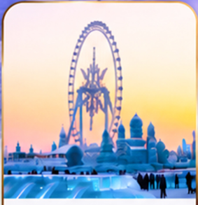
เทศกาลแกะสลักน้ำแข็ง Harbin Ice and Snow Festival