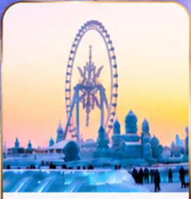
เทศกาลแกะสลักน้ำแข็ง Harbin Ice and Snow Festival