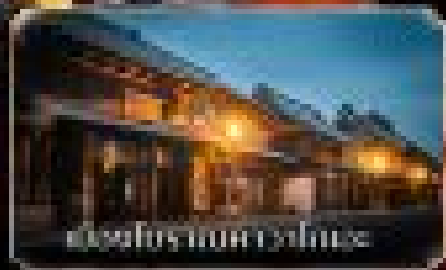
ที่พักริวจิมัทสึ