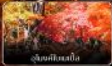
ล่องคิโอบะเนโงะ

04-08 พฤศจิกายน 2569 11-15 พฤศจิกายน 2569