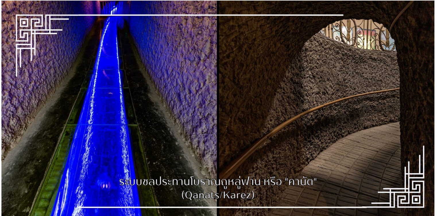
ระบบชลประทานโบราณคูหลู่ฟาน หรือ "คานัต" (Qanats/Karez)

ระบบชลประทานโบราณคูหลู่ฟาน หรือ “คานัต” เป็นระบบส่งน้ำใต้ดิน ในเขตซินเจียง ประเทศจีน ใช้ภูมิปัญญาชุดอุโมงค์ ใต้ดินเชื่อมต่อกัน เพื่อนำน้ำจากหิมะละลายบนภูเขามาใช้ในโอเอซิสทะเลทราย ลดการระเหยของน้ำ ทำให้เมืองคูหลู่ฟาน อุดมสมบูรณ์และเป็นแหล่งปลูกองุ่นขึ้นชื่อ