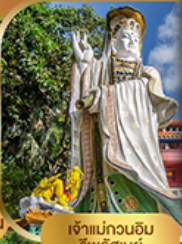
เจ้าแม่กวนอิม ริวลิสมย์