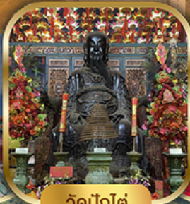
วัดปึกใต้