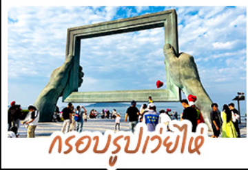
กรอบรูปเว่ยไฉ่

ถ่ายรูปย่านเมืองเก่าสไตล์ยุโรป • โบสถ์เซนต์โมดิก และย่านปาต้ากวน พร้อมทัวร์พิพิธภัณฑ์โรงเบียร์ชิงเต่าระดับตำนาน ฟรี! ซิมเบียร์สดทานละ 1 แก้ว เช็กอินมัมมาซานฟีลอนี่เม่ที่ถนนคนเดินสายที่ 8 • แวะถ่ายรูปสุดอาร์ตกับ ซากเรือลูวู • ตกค่ำตะลุยของกินที่ตลาดสไตล์เกาหลี ถนนอันเลื่องชื่อ ที่ยิวฮิสเตอร์ตามใจชอบ จัดสรรเวลาให้ท่านด้วยวัน FREE DAY 1 วันเต็มในฮ่องกง