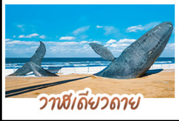
วาฬดีเซลวาฬ