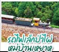
รถไฟลึกลับที่ฝอ หมู่บ้านเหมียนฮวาวาน