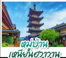
หมู่บ้าน เหมียนฮวาวาน