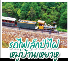
รถไฟเล็กป่าไผ่ หมู่บ้านเฉาเซว