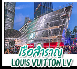
เรือสำราญ LOUIS VUITTON LV