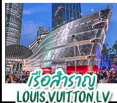
เรือสำราญ LOUIS VUITTON LV