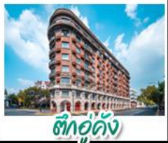
ตึกอู่คิง

หอไข่มุก - เทาหวงไฉ่ซาน - วัดพระใหญ่หลังซันต้าฝอ เรือสำราญ LOUIS VUITTON LV - ดึกอู่คิง รถไฟลึกลับหมู่บ้านเหยาหู - หมู่บ้านเหมียนฮวาวาน