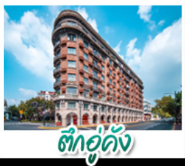
ตึกอู่กั๋ง

หอไข่มุก - เทาหนิวโล่งซาน - วัดพระใหญ่หลิงซานต้าฝอ เรือสำราญ LOUIS VUITTON LV - ตึกอู่กั๋ง รถไฟเล็กป่าไผ่หมู่บ้านหยงฮู - หมู่บ้านเหนียนฮวาวาน