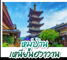
หมู่บ้าน เหนี่ยนฮวาวาน