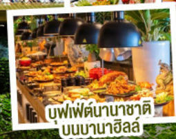
บุฟเฟ่ต์นานาชาติ บนบานาฮิลล์