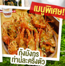
เมนูพิเศษ!