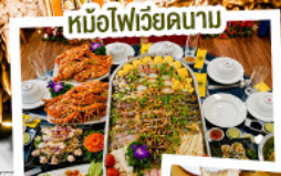
หม้อไฟเวียดนาม