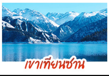
เขาเทียนชาน