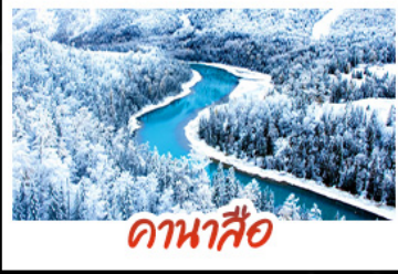
ดานาเกือ

ลู่ฮุยยานระดับโลก ชมความงามของอ่าวสี่ขงจินตรา อ่าวซุ่นมิงกรและอ่าวเทพกวดา หมู่บ้านเหมู่เหมู่ เมืองหมู่บ้านไม้ซุงสุดคลาสสิก พร้อมขึ้นจุดชมวิวดูหมอกยามเช้า นครปศาจจิ้งจอก นั่งรถไฟขบวนวิว ท่องดินแดนหินล้านปีที่ถูกลมทะเลสลัดอย่างวิจิตร