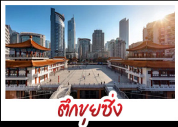
ตึกชุยซิง

พระแกะสลักหินต้าจู้ - หลุมฟ้าสะพานสวรรค์ - เวนางฟ้า ตึกชุยซิง - ตึกตะเกียบ - หมู่บ้านโบราณฉือชิว