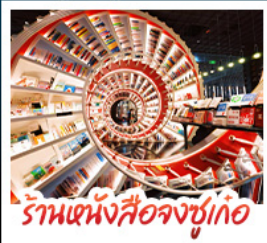
ร้านหนังสือจุงชูก่อ