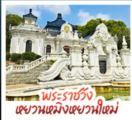
พระราชวัง เฉยวันเฉยวังเฉยวันใหม่