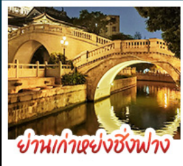
ย่านเก่าแห่งซิงฟาง