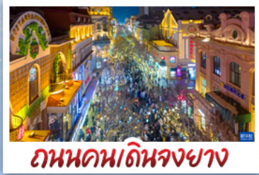
ถนนคนเดินจงยาง