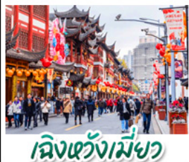
เมืองเซี่ยงเหมียว